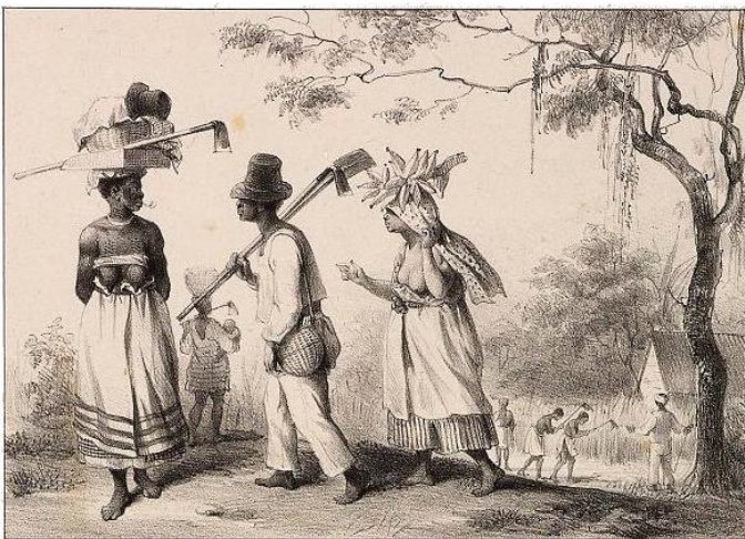
Slaven op weg naar het werk.