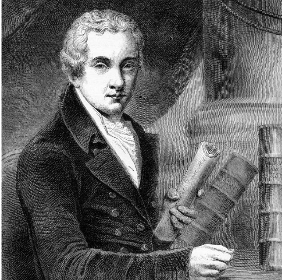
William Wilberforce (1759-1833), Engelse initiatiefnemer voor de afschaffing van de slavernij.

Aan het einde van de achttiende eeuw ontstond er in Engeland verzet tegen de slavernij. Grootste voorvechter was William Wilberforce (1759 -1833). In 1807 schafte Engeland de slaven - handel af en in 1833 volgde de totale slavernij. Koning Willem I tekende in 1814 in Nederland voor de afschaffing van de handel in slaven, de eerste stap naar de totale afschaffing van slavernij. In 1853 ontving koning Willem III een petitie met 670 handtekeningen voor de afschaffing van de slavernij. Zo ver kwam het niet meteen, maar particulieren bleven actie voeren. Een in Amsterdam opgericht (dames)afschaffingcomité